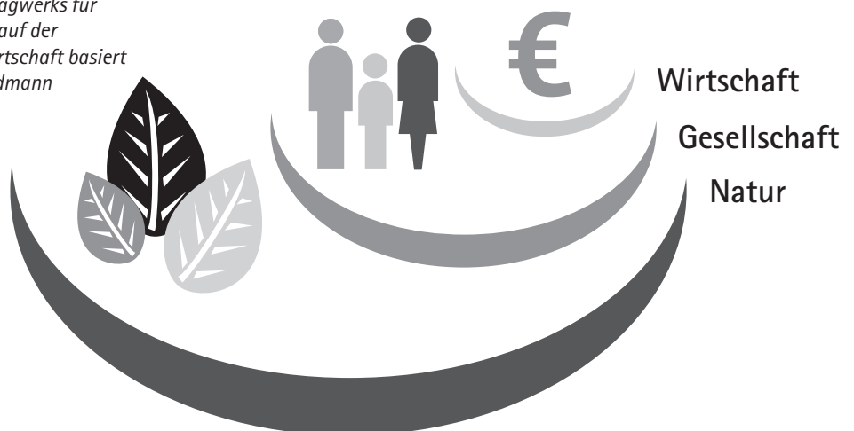
Abbildung 1: Natürliche Lebensgrundlagen übernehmen die Funktion eines Tragwerks für die Gesellschaft, auf der wiederum die Wirtschaft basiert (Quelle: nach Hildmann 2003, S. 30)

Zukunftsfähigkeit lässt sich in diesem Zusammenhang auf drei Wegen erreichen: Effizienz, Konsistenz und Suffizienz. Effizienz richtet sich auf die ergiebigere Nutzung von Materie und Energie, also auf Ressourcenproduktivität. Konsistenz sucht nach naturverträglichen Technologien, die Stoffe und Leistungen der Ökosysteme nutzen ohne sie zu zerstören. Suffizienz strebt einen geringeren Verbrauch von Materie und Energie an durch eine geringere Nachfrage nach Gütern und Dienstleistungen mit hohem Ressourcenanteil (mit einem